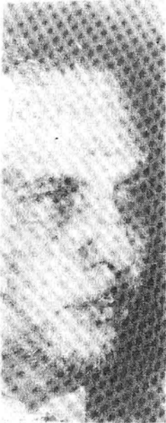
الزعيم علال الفاسي

فكان مشروع حلف إسلامي في الهواء، لهذا كان يحضر مشروع قمة إسلامية ما بين رؤساء دول إسلامية طوال سنة 1966.